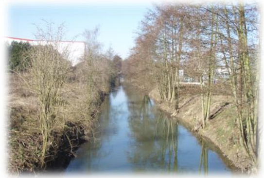
Lit du Thérain canalisé et berges remblayées

Au fil des siècles et des aménagements industriels ou hydrauliques, la rivière s'est trouvée partiellement déconnectée de son lit majeur engendrant une perte des fonctions écologiques et une réduction importante des Zones d'Expansion naturelles des Crues.