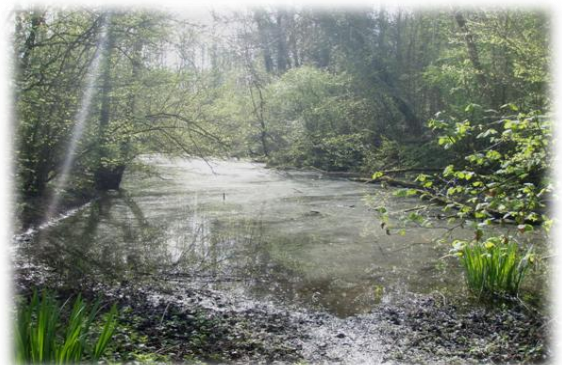
Marais stockant de l'eau au printemps

Cette étude a pour objectif de reconnecter les ZEC dégradées (marais, forêts, prairies), dans le lit majeur du Thérain entre Beauvais et Montataire pour protéger les zones habitées en période de crue.